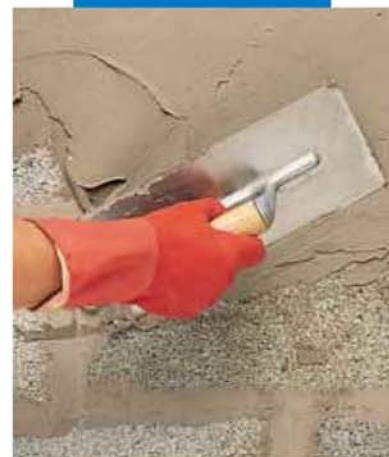
Нанесение Idrosilex Pronto мастерком