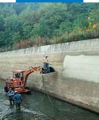
Нанесение Idrosilex Pronto напылением на подводный канал гидроэлектростанции