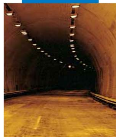
Нанесение белого Idrosilex Pronto напылением в автодорожной галерее