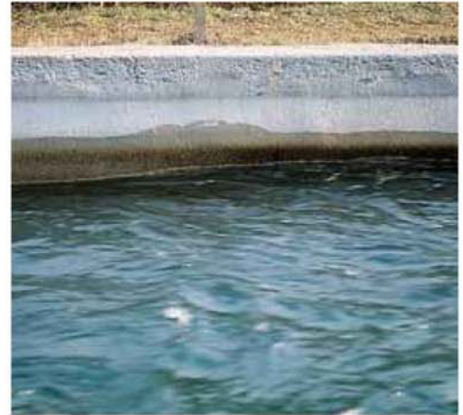
Подводящий канал ГЭС в г. Бертини – Ровьяте (Область Комо) с поверхностью, обработанной Idrosilex Pronto