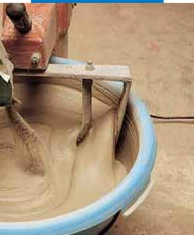
Смешивание серого Idrosilex Pronto с водой